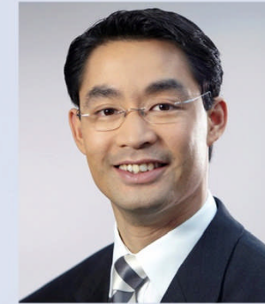
Dr. Philipp Rösler