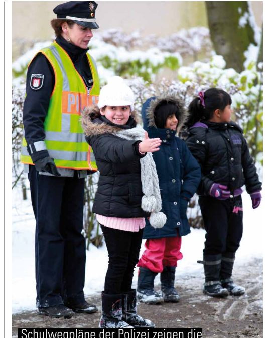
Schulwegpläne der Polizei zeigen die sichersten Wege zur Schule und sind kostenlos in jeder Grundschule erhältlich.

Verkehrsdirektion 6 der Polizei Tel 040. 428 65-54 30 vd6@polizei.hamburg.de www.hamburg.de/verkehrssicherheit