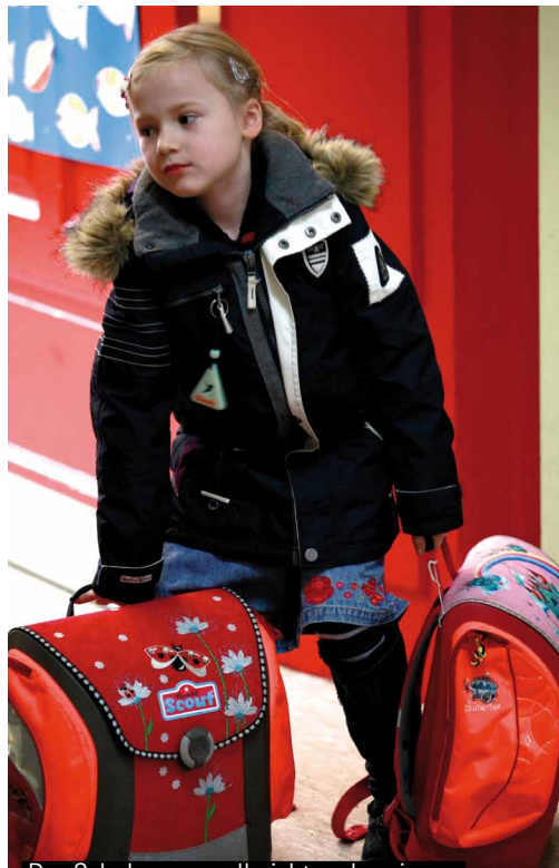
Der Schulranzen soll nicht mehr wiegen als ein Zehntel des Körpergewichts des Kindes.

Zeigen Sie Interesse daran, was Ihr Kind in der Schule macht und woran es gerade arbeitet. Sie unterstützen Ihr Kind, wenn Sie es gegebenenfalls zur Bücherhalle begleiten oder mit ihm zusammen in den Park gehen. Aber Sie sollten ihm die eigentliche Aufgabe nicht abnehmen. Helfen Sie Ihrem Kind dabei, selbstständig zu werden.