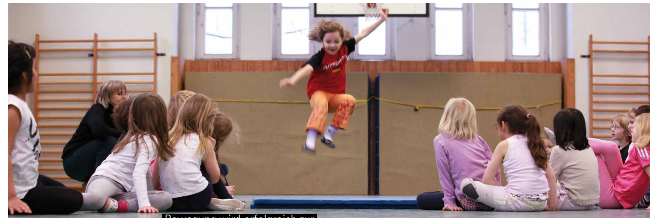
Bewegung wird erfolgreich zur Unterstützung des Lernens in anderen Unterrichtsfächern genutzt.

Es ist sehr wichtig, dass Sie von Anfang an über die Lern- und Leistungsentwicklung Ihres Kindes gut informiert sind. Sprechen Sie von Zeit zu Zeit mit der Klassenlehrerin oder dem Klassenlehrer Ihres Kindes einen Termin ab und fragen Sie nach dem Verhalten in der Klasse – nach Kontakten zu anderen Kindern, nach der Mitarbeit im Unterricht, nach Lernfortschritten und ob Ihr Kind schon in der Lage ist, in angemessener Weise Pflichten und Verantwortung zu übernehmen. Für die Lehrerinnen und Lehrer wiederum ist es wichtig zu wissen, wie Ihr Kind zu Hause auf die Schule reagiert. Erzählen Sie den Pädagogen, was Sie beobachten und erfahren.