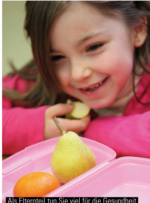
Als Elternteil tun Sie viel für die Gesundheit Ihres Kindes, wenn Sie ihm einen gesunden Pausensnack mitgeben.

www.li.hamburg.de/gesundheitsfoerderung Arbeitsbereich Gesundheitsförderung, Sexualerziehung und Gender Dieter Wilde Tel 040. 42 88 42-741 dieter.wilde@li-hamburg.de