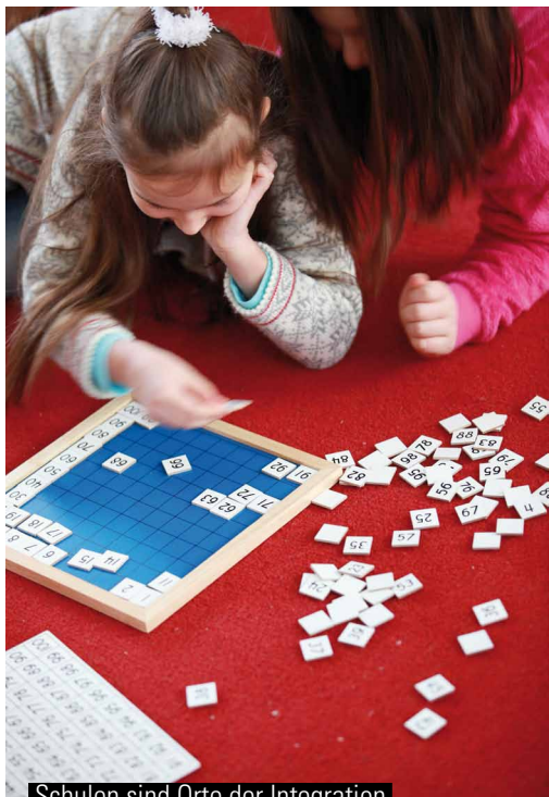
Schulen sind Orte der Integration. Ziel ist nicht eine kompromisslose Angleichung, sondern wechselseitige Wahrnehmung und Wertschätzung.

Schulen sind Orte der Integration. Ziel ist nicht eine kompromisslose Angleichung, sondern wechselseitige Wahrnehmung und Wertschätzung. Die Lehrkräfte mit und ohne Migrationshintergrund gestalten den Unterricht so, dass Gülay, Marie und