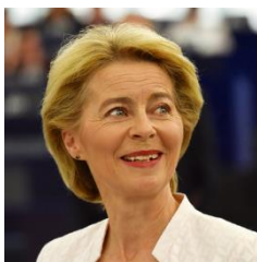
Ursula von der Leyen

Mit der vorliegenden Mitteilung kommen die Präsidentin der Europäischen Kommission und der Präsident des Europäischen Rates der Bitte der Mitglieder des Europäischen Rates nach, eine mit den Mitgliedstaaten abgestimmte Strategie für die Zeit nach der Krise zu entwickeln, die den Weg für einen umfassenden Erholungsplan und für beispiellose Investitionen ebnet.