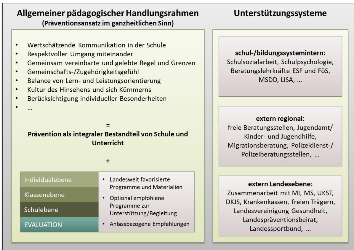
Abbildung 3. Bestehendes Präventionssystem und Ansatzpunkte für die Weiterentwicklung schulischer Gewalt- und Suchtprävention in Sachsen-Anhalt.

Eines der bewährtesten Präventionsfelder ist der Unterricht selbst. Der fachbezogene Bildungsauftrag der Schule wird hier ergänzt um die ganzheitliche, soziale Bildung junger Menschen. Neben der gezielten Wissensvermittlung und Herausbildung spezifischer Kompetenzen betreibt Schule über die Gestaltung des Klimas im Sinne eines förderlichen Miteinanders grundständige Präventionsarbeit im Sinne der Primärprävention. Die detaillierte Ausgestaltung obliegt den Schulen (für die Schulebene) bzw. den einzelnen Lehrkräften (für die Klassen- und Individualebene). Sie können dabei auf bereits bewährte Bausteine zurückgreifen, bspw.: