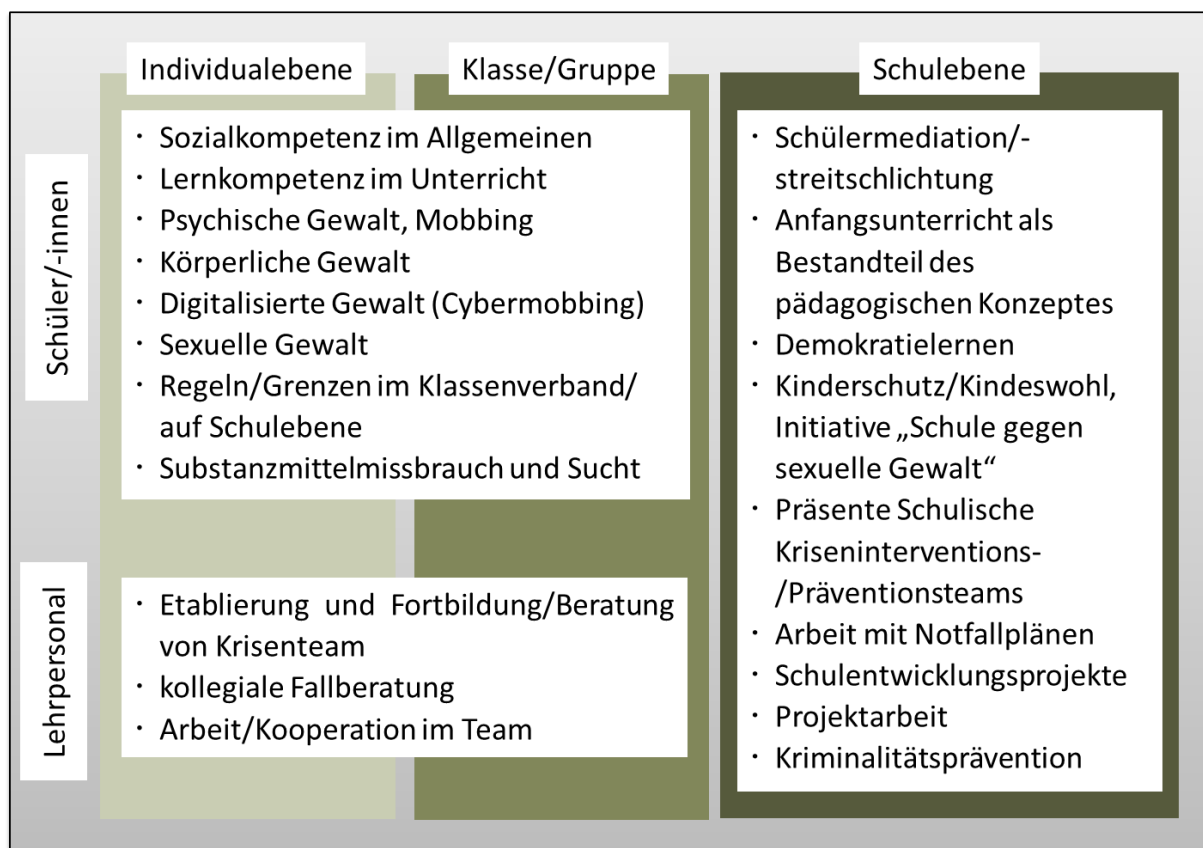
Abbildung 2. Übersicht über mögliche unterrichtsimmanente und zusätzliche Präventionsangebote.

Zum Zweck der systematischen Gewaltprävention i. e. S. wurden zahlreiche Programme entwickelt. Je nach Fokussierung beziehen sie sich z. B. auf Prävention körperlicher, psychischer oder auch sexueller Gewalt. Diese Präventionsprogramme/Präventionsmaterialien richten sich an ganze Klassenverbände oder aber definierte Schülergruppen.