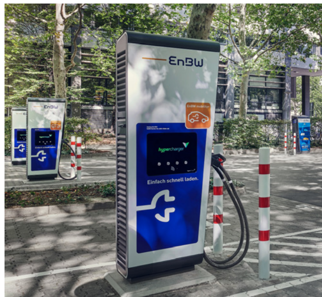
Innerstädtische Schnellladeparks: Während kurzer Besorgungen lädt die Batterie des E-Autos nebenbei voll.

An öffentlichen Stellplätzen in zentralen Lagen oder auch bei Parkplätzen des Handels sollten E-Autos dagegen schnell frische Reichweite laden können. Das Fahrzeug steht hier meist einige Minuten bis eine Stunde. Dafür braucht es Schnellladepunkte: Mithilfe des dort verfügbaren Mittelspannungsnetzes können E-Autos bei Ladeleistungen bis 300 Kilowatt in fünf Minuten 100 Kilometer Reichweite laden. Auch Schnellladeparks bieten diese Möglichkeit und verfügen, je nach Größe und Ausstattung, unter anderem über eine Überdachung, Licht und WLAN.